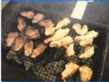
もちろん鶏肉もご用意させていただきます!