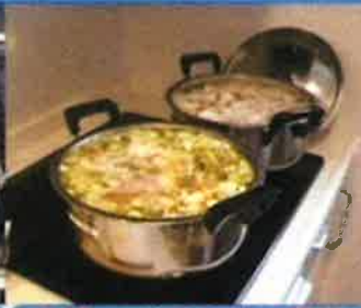
大鍋2つ分の季節の野菜 たっぷり豚汁!

「味覚祭メニュー」 ・ さつまいもご飯の おにぎり ・ 季節の具沢山豚汁 ・ 秋刀魚の炭火焼 ・ 焼肉各種 ・ 季節の果物 柿とリンゴの フルーフボンチ