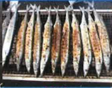
炭焼き 焼き立ての秋刀魚です!